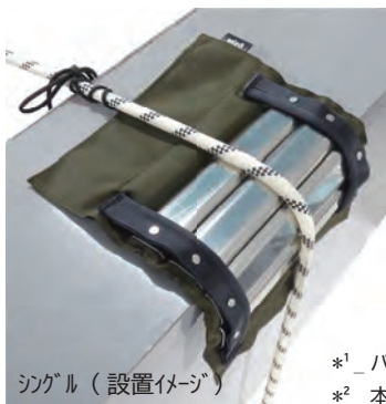
シングル（設置イメージ）