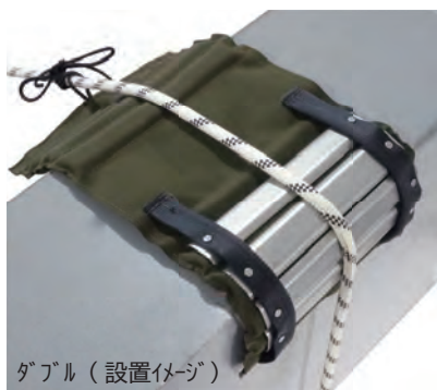
ダブル（設置イメージ）

なめらかなプレートはロープへの摩擦 抵抗を下げ、重量が高層階 でのロープ引上げに役立ちます。